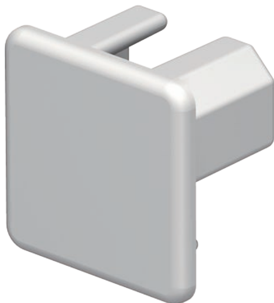
Gala elements WDK kanālu aizvēršanai.