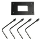
703098000300 LEDBollard-Luke-E Concrete-Mounting-Kit