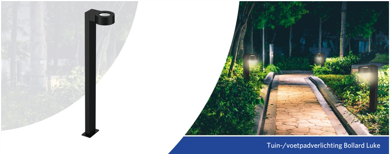
Tuin-/voetpadverlichting Bollard Luke