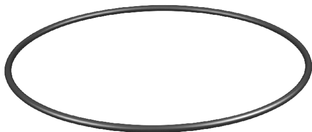
Blīvgredzens caurulei TUK2 – rezerves daļa.

EPDM Etilēna-propilēna-diēna kaučuks DIN 1629