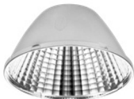
550098000500 LEDSpot3C-C-P R100- Reflector-24D