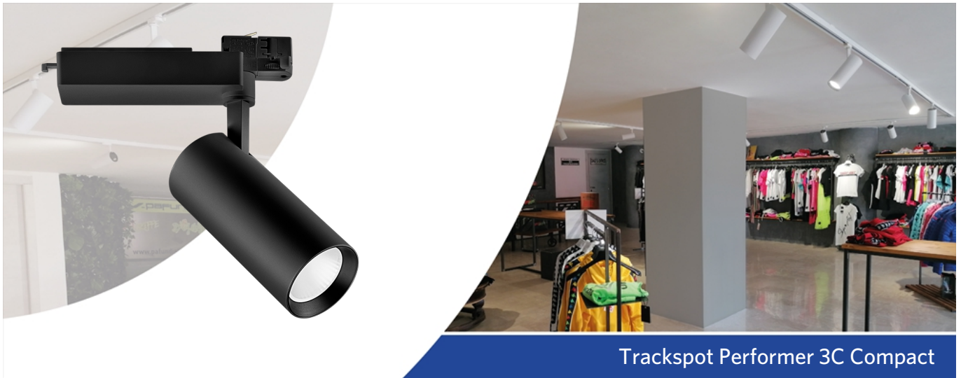
Trackspot Performer 3C Compact