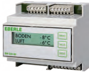
EM 524 89 – für 1 Zone / for 1 zone