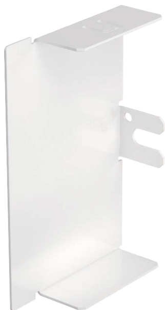
Gala elements LKM kanālu aizvēršanai.