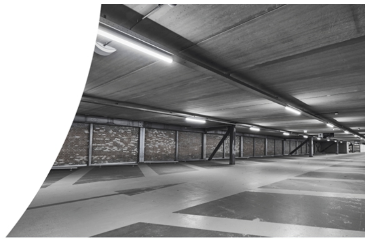
Waterdichtarmatuur Waterproof Classic