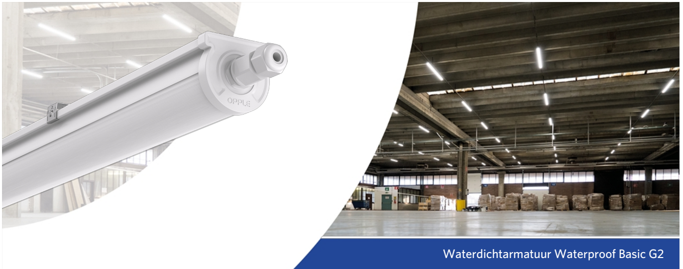
Waterdichtarmatuur Waterproof Basic G2