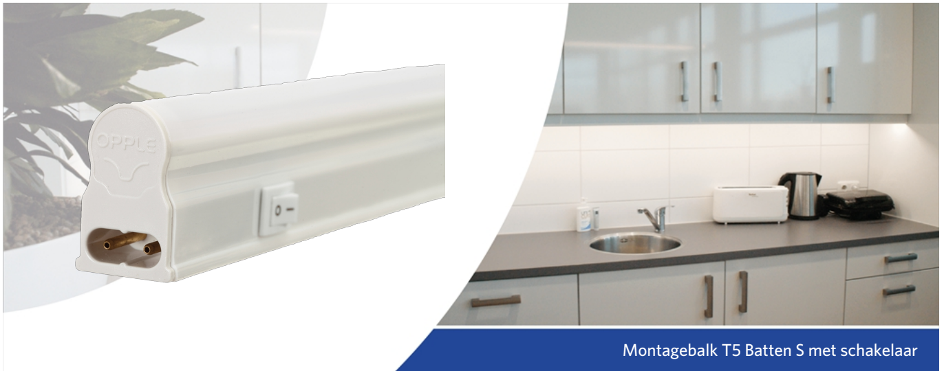
Montagebalk T5 Batten S met schakelaar