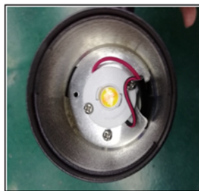
Figure3 Remove the reflector