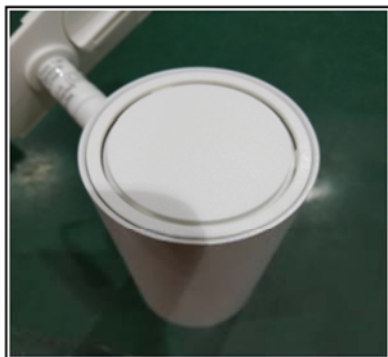
Figure1 Remove the top cover