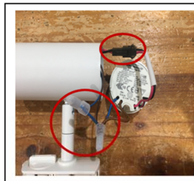
Figure2 Loose the connection