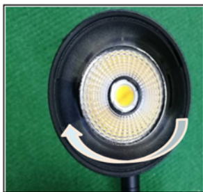
Figure2 Remove the front cover