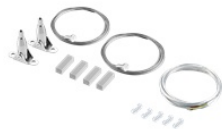
599006009000 LEDLima Suspension-Kit