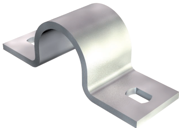
Stiprinājuma apskava, stiprināma abās pusēs, 25 mm