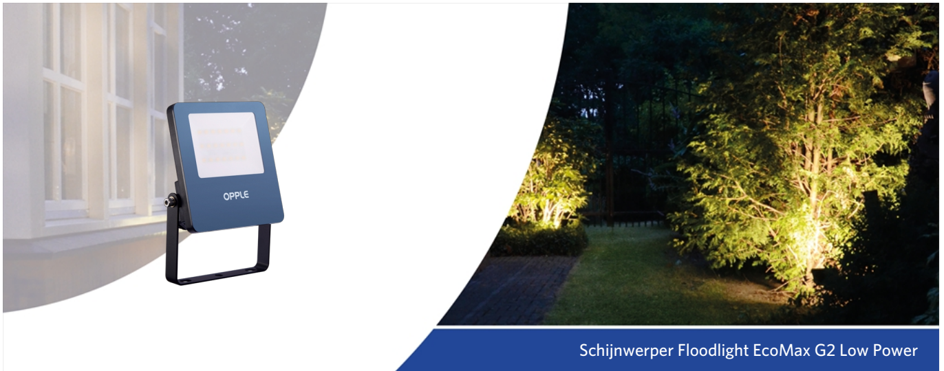
Schijnwerper Floodlight EcoMax G2 Low Power