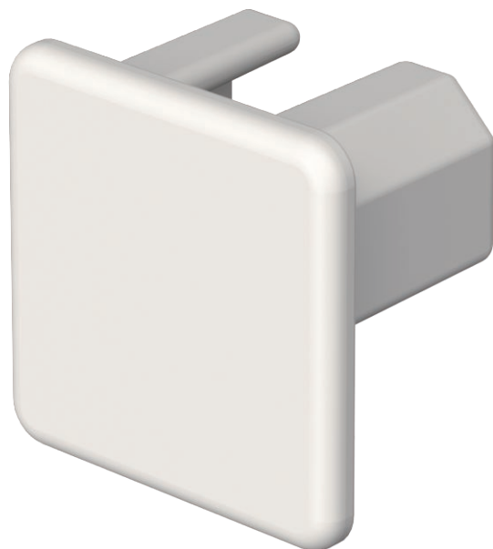
Gala elements WDK kanālu aizvēršanai.