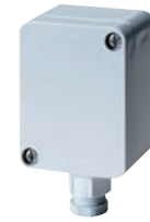
Fühler für Außenmontage Sensor for outdoor mounting