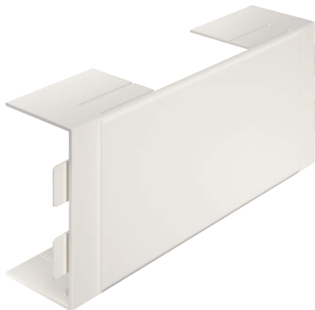
Gala elements WDK kanālu aizvēršanai.